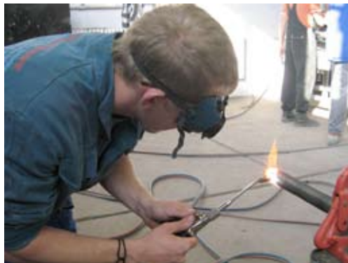
Szintvizsga a gázerelőknél

A tájékoztató anyag megjelenését az MPA terhére a Nemzetgazdasági Minisztérium támogatta. Szerződésszám: MPA-KA-NGM 9/2011.