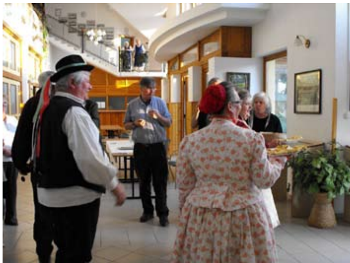
Magyaros, tápéi vendégfogadás