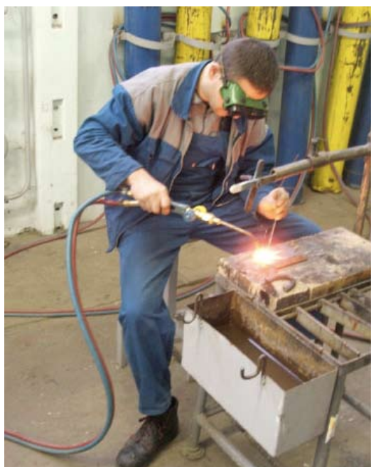
Hegesztőkre nagy a kereslet a munkaerőpiacon

– A szakmai vizsgákkal kapcsolatban már jeleztem, hogy problémásnak látom, ha a felkészítő intézményt képviselő kérdező tanár szerepét megszüntetik. Ha másért nem, azért, mert ki tud hasonló szakértelemmel, oktatói felkészültséggel rendelkező kérdező tanárt biztosítani? Ha csak nem a konkurens iskola, ami megint nem biztos, hogy szerencsés lenne. (Esetleg létre kell hozni a „szakértő vizsgabizottsági tag” státusát, aki egy olyan gyakorló szakember, aki tökéletesen tisztában van az iskolai tananyaggal és az ➤