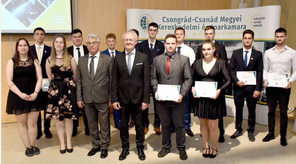
Dobogós helyezésű tanulók közös fotón a kamara elnökével és kézműves alelnökével.

A projekt a Kulturális és Innovációs Minisztérium finanszírozásában valósul meg a Nemzeti Foglalkoztatási Alap képzési alaprésze terhére. A projekt és a Közreműködői szerződés száma: NFA-KA-KIM-6/2023/TK/05.