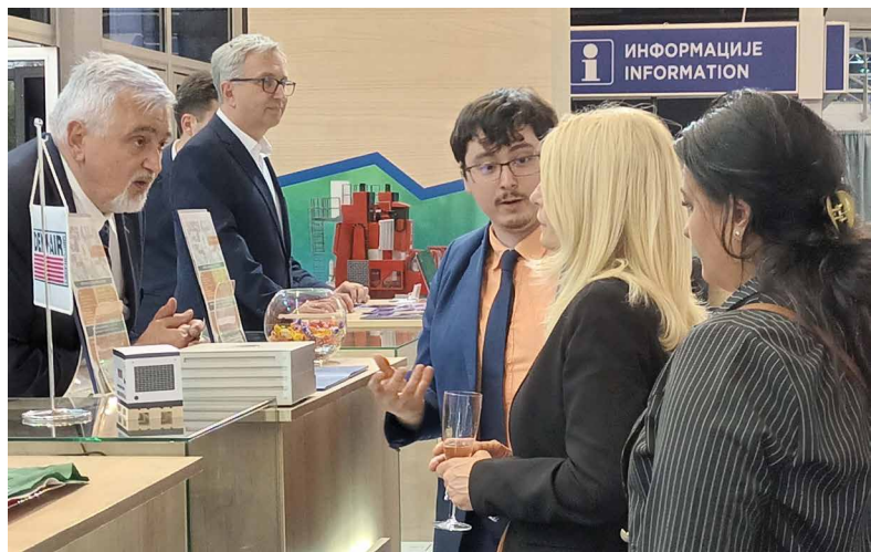
A szerb innovációs miniszter asszony a szegedi SolVElectric standjánál

Kiállítóink: Ledium Kft., Moltech AH Kft. és a Solvelectric Kft.