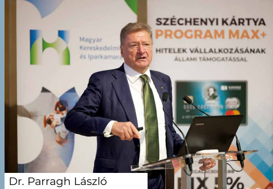
Dr. Parragh László

adják, ezért a kormány igyekszik minél több segítséget, támogatást nyújtani a vállalkozóknak azért, hogy újra tudják indítani a fejlesztéseiket. Jelezte, ennek egyik eszköze a GINOP 1.4.3-24 kódú kiírás, melyre április 30-ától nyújthatják be kérelmeiket az érintettek, 10 és 100 millió forint közötti összegekre pályázhatnak. A kiírás keretösszege 155 milliárd