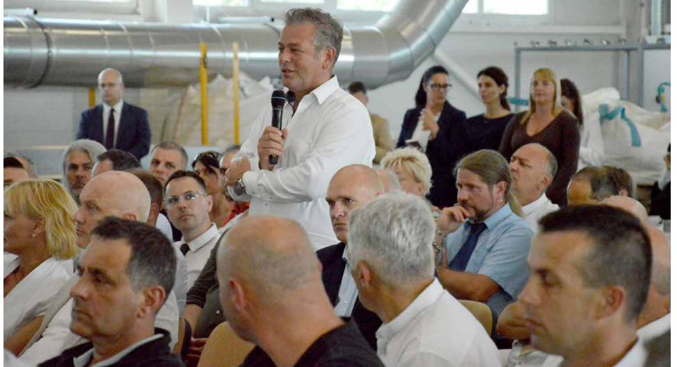
A vállalkozók kérdezték

nyel, hogy hazánkban világszínvonalú az internetlefedettség. Az a minimum, hogy legyen honlapjuk, és tegyék elérhetővé a legfontosabb céginformációkat.