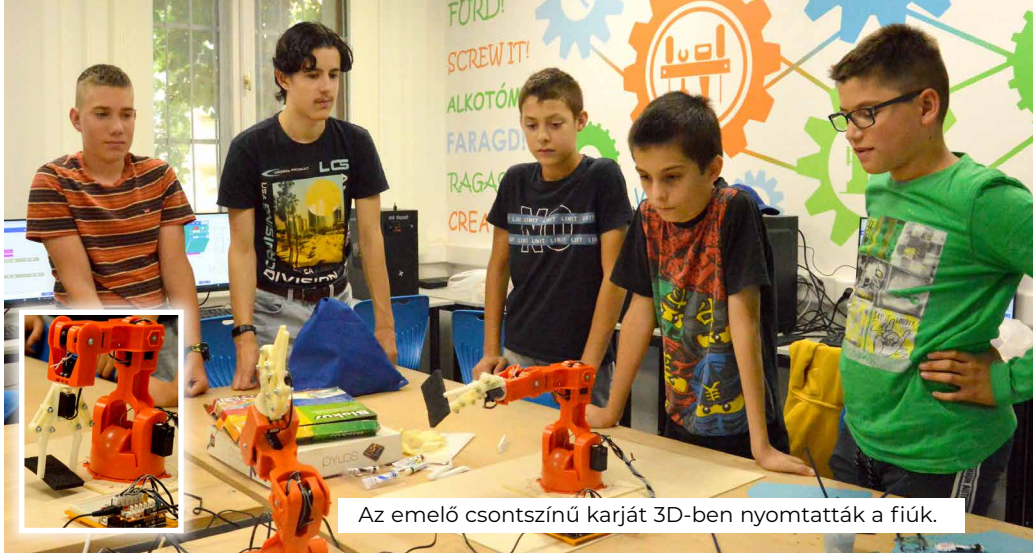
Az emelő csontsínű karját 3D-ben nyomtatták a fiúk.