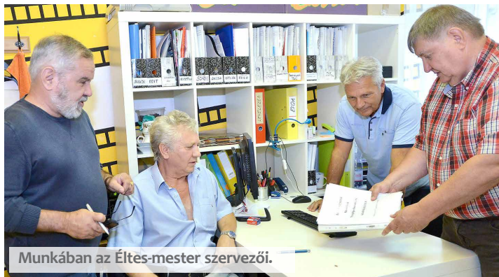
Munkában az Éltes-mester szervezői.

A szövetkezet alapítói is valamennyien nyugdíjasok, de erősek, tettere készek és ma is ambíciózusak. Vallják és hiszik, hogy a hozzájuk hasonló mentális nyugdíjasok igen sokat tehetnek még hozzá nemcsak a saját boldogulásukhoz, hanem gazdasági szereplők, a vállalatok, a közintézmények és közös jövőnk eredményeihez, sikereihez. Például, mint emlegetik, a fiatalok betanításához is nekik van legnagyobb tapasztalatuk és türelmük. A nyugdíjas szövetkezet tevékenysége egyébként tényleg a diákszövetkezetekéhez hasonlítható leginkább, csak míg az utóbbiak mai diákokat,