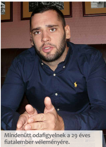
Mindenütt odafigyelnek a 29 éves fiatalember véleményére.

– A vásárhelyi vállalkozók elfogadták, komolyan veszik önt is meg a kamarát is. Hogyan fogadták a kamara legfontosabb külső partnerénél, az önkormányzatnál?