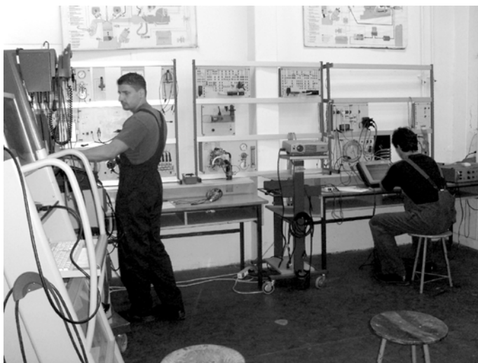
Mesterképzés az autószerelőknél.

a kredit rendszerű továbbképzés, tudásfrissítés feltételeit.