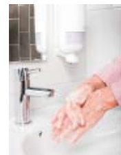
Tork személyhigiénia Kéztörlő, szappan 990 Ft+áfától