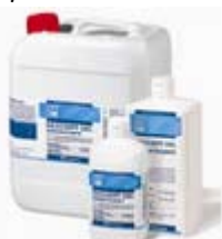
Dezosept Gel Kézfertőtlenítő 200 ml 765 Ft+áfa

A Silko Hygiene Kft., mint a CSMKIK tagja felajánlja szakértelmét azon tagok részére, akik élni kívánnak a lehetőséggel, és kéri egyedi ajánlatunkat ( info@torkszege.hu ), víz nélküli kézfertőtlenítőre, mely autóban kiválóan alkalmas a rendszeres kézfertőtlenítésre, és cégek telephelyein, irodáiban olcsón kívánják emelni a higiénia szintjét.