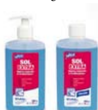
Ultra Sol Extra Fertőtlenítő szappan 474 Ft+áfa