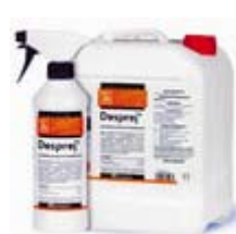
Desprej Felületfertőtlenítő 684 Ft+áfa