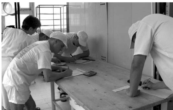
Mesterképzés a pékeknél.

gi körébe tartozik a mesterképzés, mestervizsgáztatás és a mesteri tudás elismertetésének lehetősége, nagyobb súllyal és eréllyel kell képviselniük a mesterügyet.