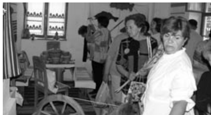
Megnyílt a kiállítás