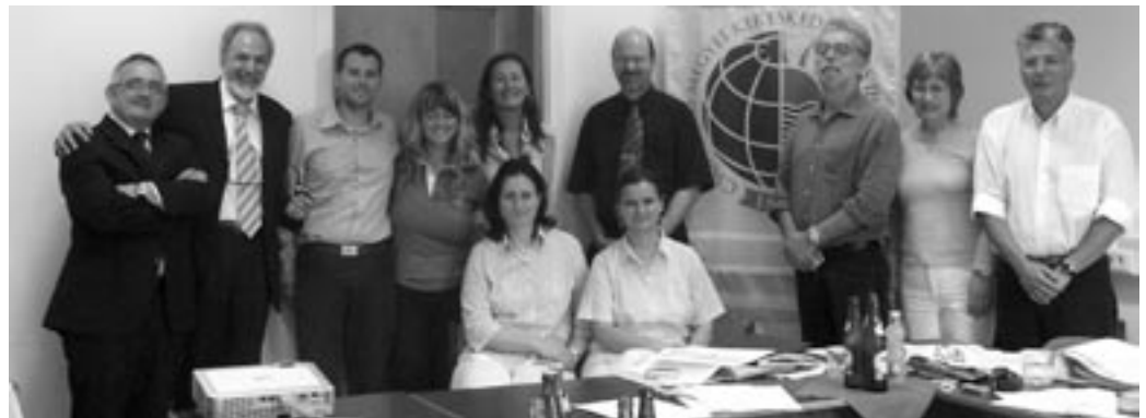
Munkavállaló-barát oktatási csomagon dolgozik a LE-PEX-csapat

A projektben együttműködő olasz, német, portugál, görög és magyar partnerek igyekeznek feltárni az országaikban érvényben lévő, a szakképzés ezen területét érintő szabályozási hátteret. A különféle munkacsomagok keretében a gyakorlati oktatók kompetenciaprofiljának a feltérképezésére kerül sor helyi hálózatok aktív bevonásával. A kiinduló feltételezés az, hogy nem eléggé, illetve az egyes EU-tagállamokban