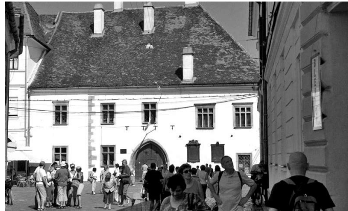
Kolozsváron van a magyar–román vegyes kamara központja.