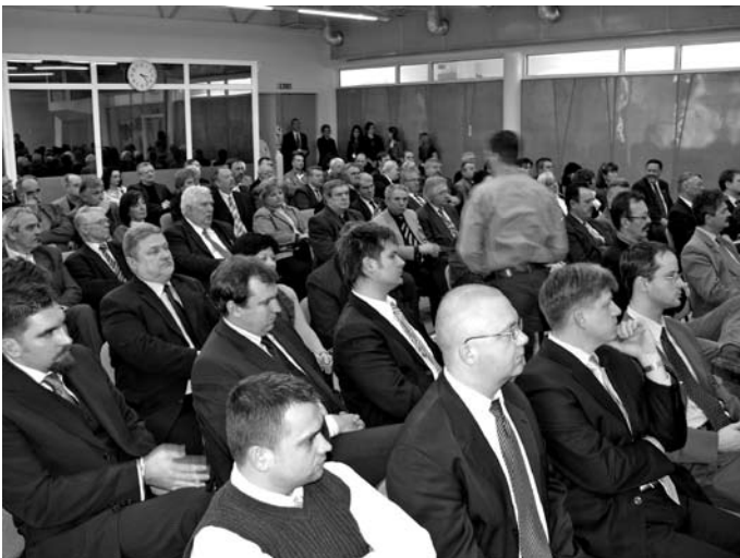
Telt ház a kamara konferenciatermében.