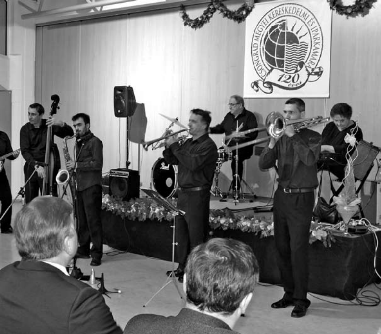
A Molnár Dixieland Band méltó hangulatot teremtett az ünnepi eseményhez.