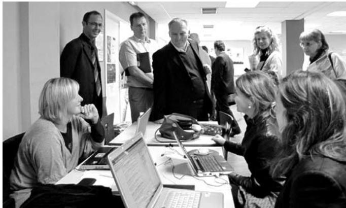
Francia tanulók között.