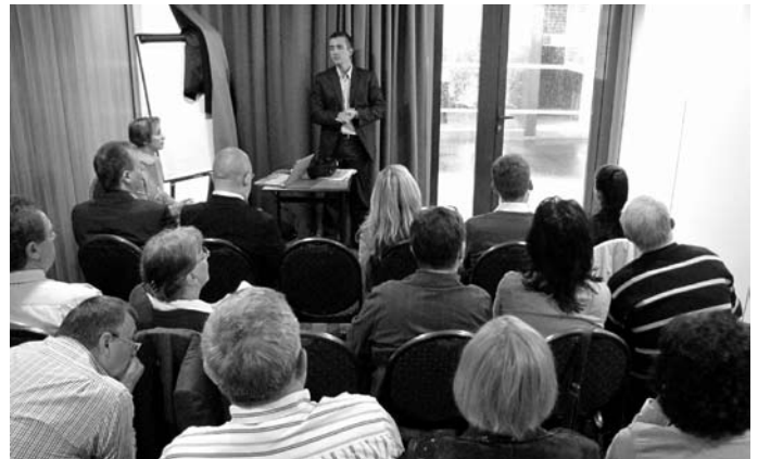
Hogyan működik a kamara Franciaországban?

A régió gazdasági ágazatai közül a mezőgazdaság és élelmiszeripar, az autógyártás, a hadiipar, a hajóépítés és -javítás, a radarok és elektromos műszerek gyártása, az információs technológia, valamint