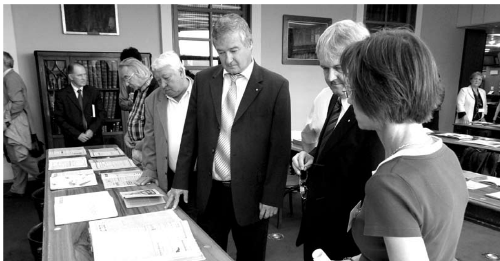
Kamarai vezetők a 120 éves kamara relikviáival ismerkednek a Somogyi Könyvtárban.