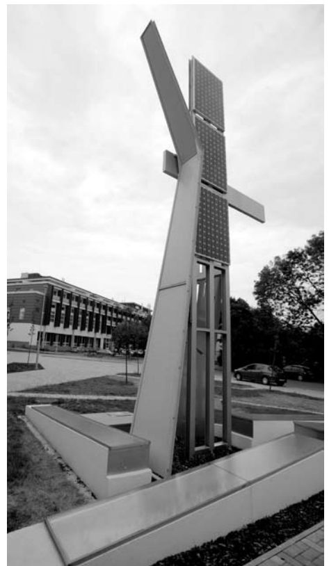
Időkapzsula a szegedi Napfényfürdő előtt – pixelbetonból.