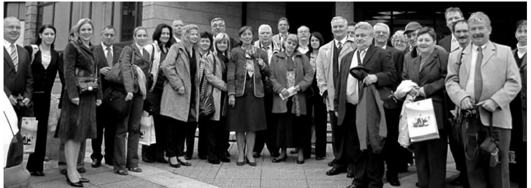
Csongrád megyei vállalkozók, kamarai szakértők Bretagne-ban.

A kamarai delegációnak a megyei önkormányzat, Bretagne régió szakképzési hivatala, a Bresti Kereskedelmi és Iparkamara, a Quimper Kézműves Kamara, számos jelentős szakképzési intézmény, valamint az Enterprise Europe Network Bretagne képviselője mutatta be a francia