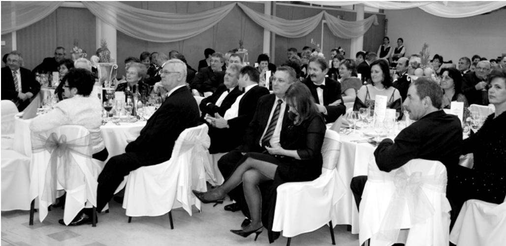
A program szervezőinek gyakran sikerült megragadni a vendégek figyelmét.

társasági eseménye a kamarának, amikor a vállalkozók kötetlen formában is találkozhatnak egymással, meglévő vagy potenciális üzleti partnereikkel.