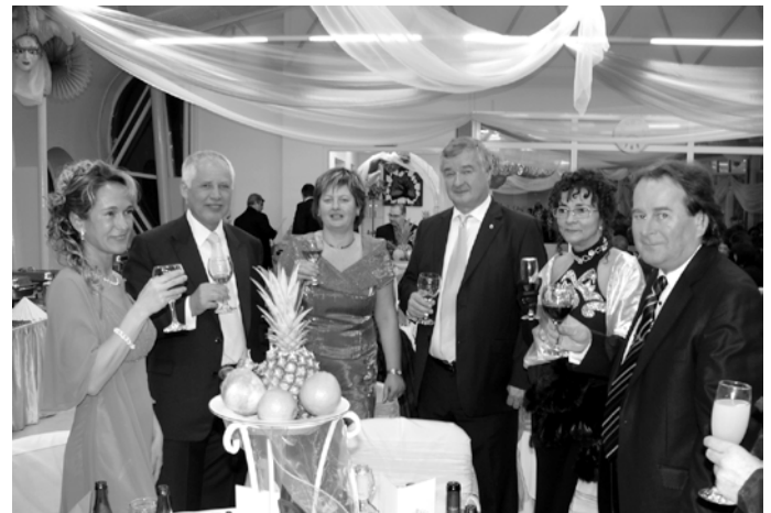
Koccintottak a díjazott egészségére