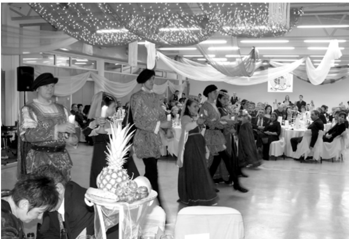
„Munkában” a Pavane táncsoport