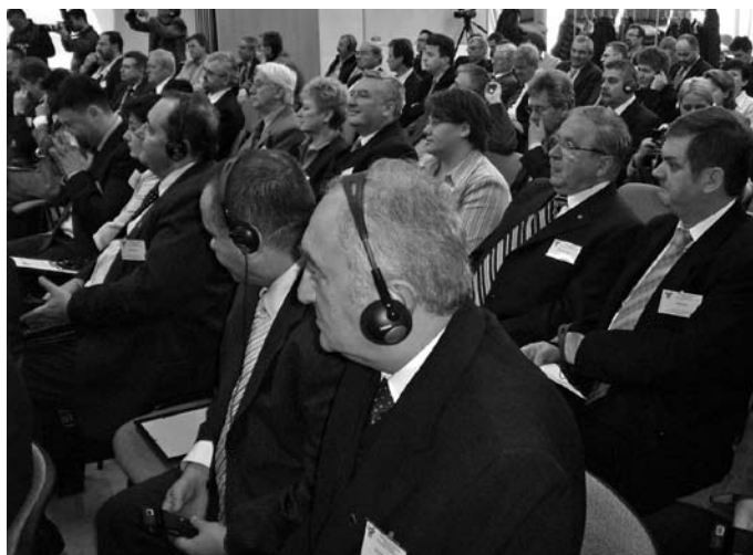
Rendszeres a telt ház a kamarában.

szakértőkig sokan és gyakran fordulnak meg a székházban. Persze mindig okkal, hiszen a nyitott, széles körű partnerségben folyó kamarai munka eredményeként magas a száma az olyan szakmai tanácskozásoknak, találkozásoknak, amelyeken a résztvevők mindig a térség fejlődésén, a vállalkozók, s egyáltalán az itt élő emberek boldogulásán törik a fejüket. (Akkor is, ha a közlekedésről, az építőiparról vagy a román, szerb, bosnyák befektetési lehetőségekről