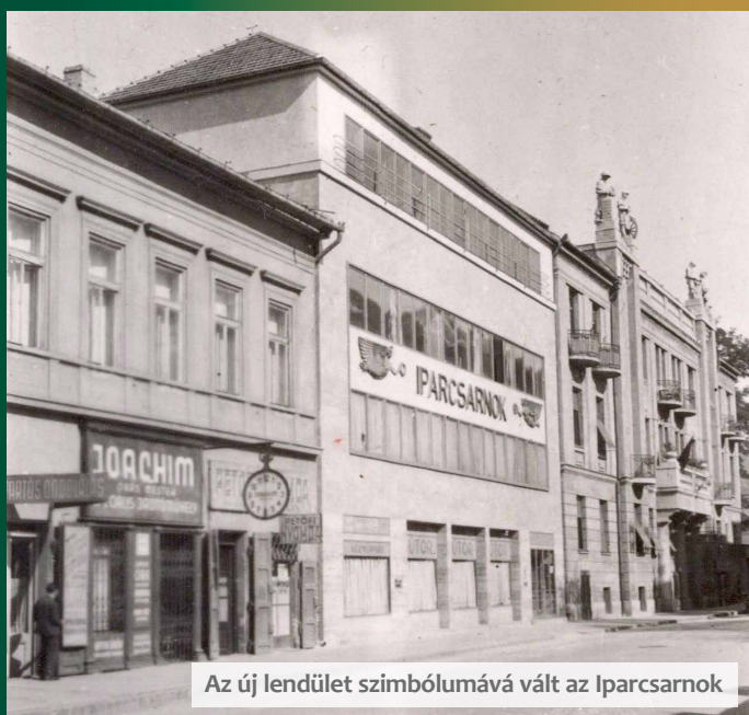
Az új lendület szimbólumává vált az Iparcsarnok

A hagyományokat folytatva, megújult formában, a Somogyi-könyvtár helyismereti gyűjteményében fellelt kincseken keresztül fonódik egybe múlt és jövő. Időutazásra invitálja az olvasót a Múltidézés a Somogyi-könyvtárral elnevezésű rovatunk, amely a helyi kereskedelem és kézművesség kulisszái mögé nyújt betekintést hónapról hónapra.