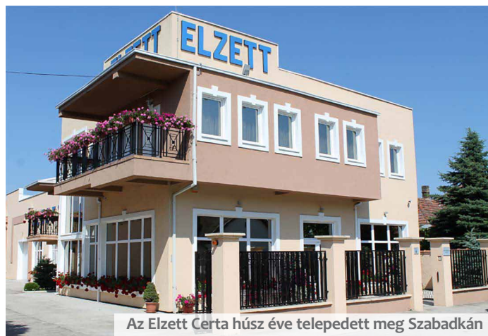
Az Elzett Certa húsz éve telepedett meg Szabadkán