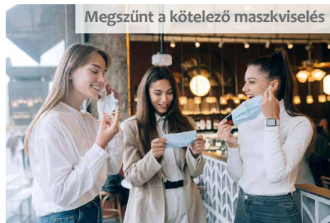
Megszűnt a kötelező maszkviselés

Lényeges változás, hogy szeptembertől bekerül a kereskedelmi törvénybe a szálláshely-minősítés fogalma, és a minősítés szabályai, részletei. Szálláshelyenként az első szálláshely-minősítési eljárás ingyenes lesz, ezt követően azonban igazgatási szolgáltatási díjat kell fizetni. Előre