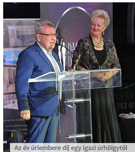
Az év úriembere díj egy igazi úrhölgytől

– Míg 2000-ben kétségkívül bátorság is kel-