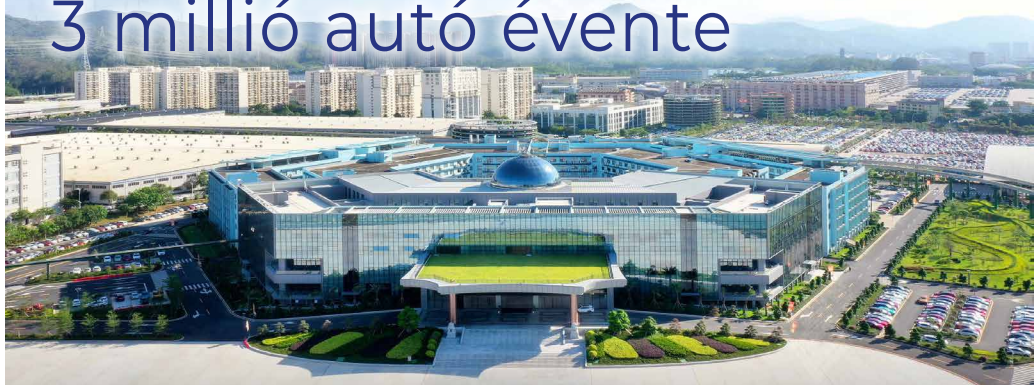
A BYD központja Sencsenben

a BYD megelőzte az eddigi csúcs-tartó Teslát.